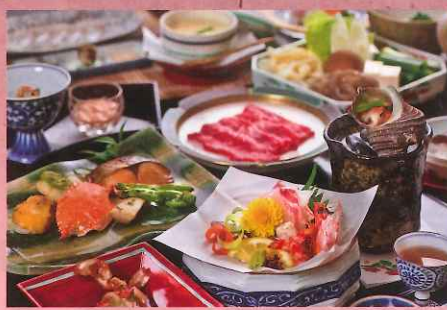
夕食イメージ(レストランにて)