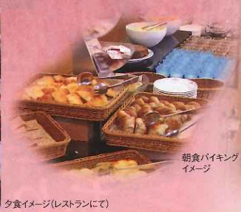
朝食バイキング イメージ