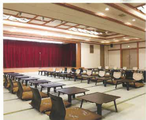
万葉の間(花・鳥・風・月)