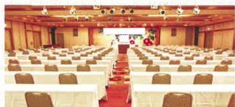
「万葉の間」: スクール形式

スクール形式、シアター形式、口の字、アイランド形式など様々な形に対応でき、 分工会など会場数がおおく必要な場合などご相談ください。