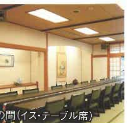
竹の間(イス・テーブル席)