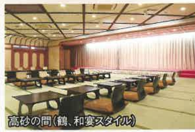
高砂の間(鶴、和宴スタイル)