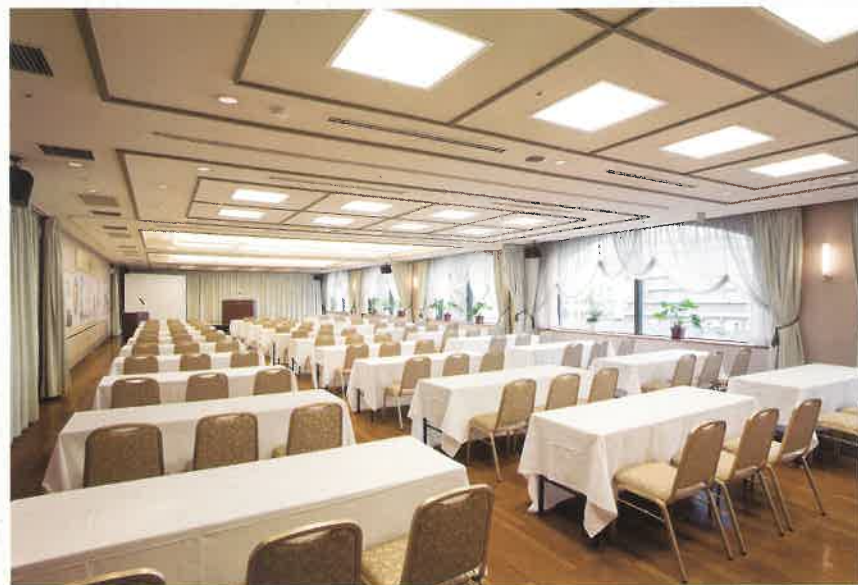
会議室「カメラホール」: スクール形式