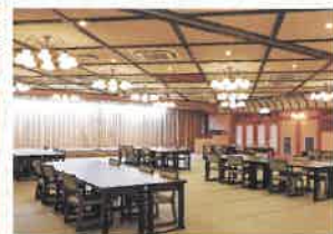
「高砂の間」: アイランド形式