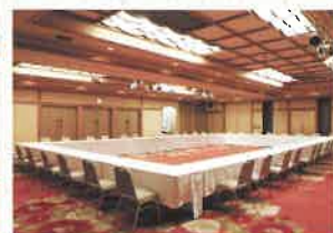
「万葉の間」: 分割で口の字形式