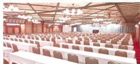
「高砂の間」: スクール形式