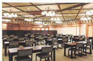
「高砂の間」: スクール形式