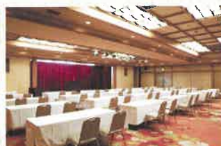
「万葉の間」: 分割でスクール形式