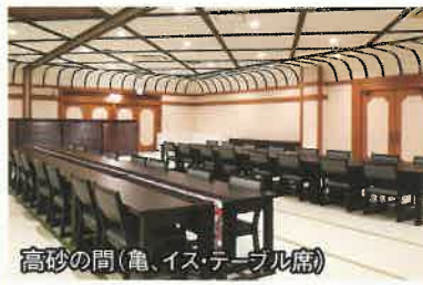
高砂の間(亀、イス・テーブル席)