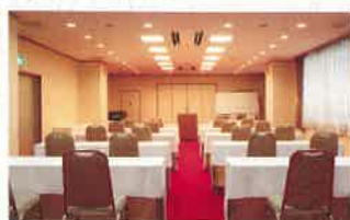
「会議室」: スクール形式