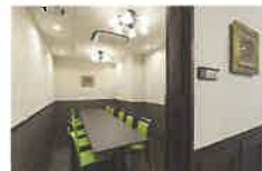
個室あります。(要予約)

※季節や仕入れ状況によって、料理の内容は異なる場合がございます。写真はイメージです。