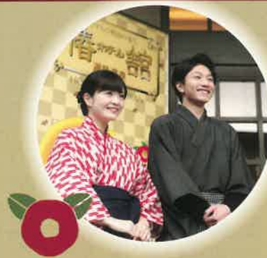
マドンナと坊ちゃん姿で お客様をお出迎え

除外日設定 (4/27~5/8・7/13・7/14・8/10~8/17・9/2・9/3・9/14・9/15・9/17・9/21・9/22)