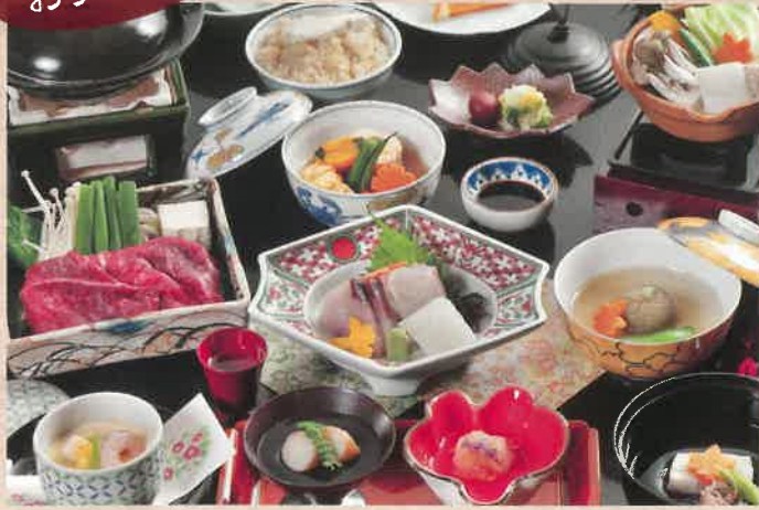
※料理写真はイメージになります。