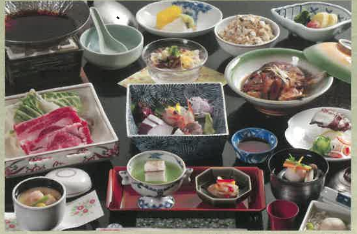
※料理写真はイメージになります。