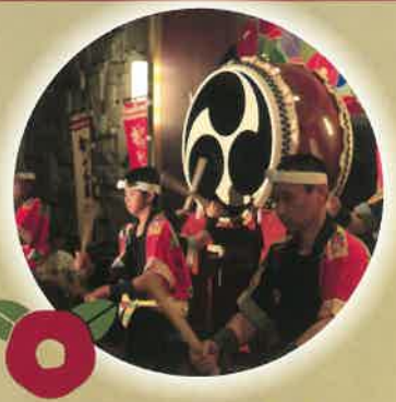
大好評!水軍太鼓ショー (休演日有)